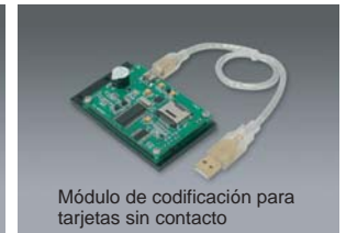
Módulo de codificación para tarjetas sin contacto