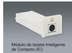
Módulo de tarjeta Inteligente de Contacto (IC)