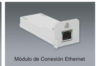
Módulo de Conexión Ethernet