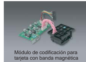
Módulo de codificación para tarjeta con banda magnética