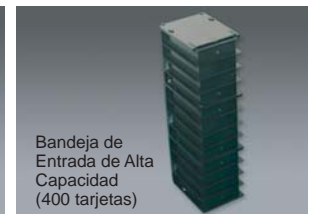
Bandeja de Entrada de Alta Capacidad (400 tarjetas)